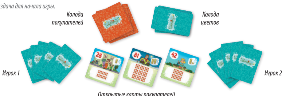
Рис.1. Раздача для начала игры.

Игроки ходят по очереди, по часовой стрелке, первым начинает ходить самый младший.