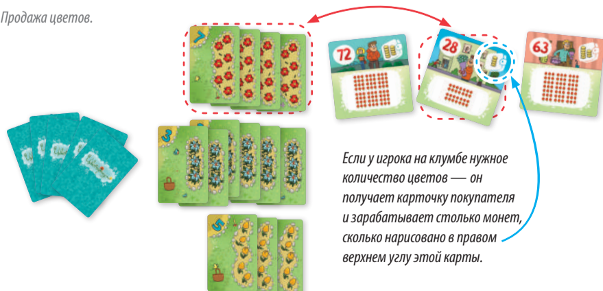
Рис.3. Продажа цветов.

Чтобы получилось нужное для продажи количество цветов, игрок может перед продажей выкорчевать часть клумбы: убрать с неё одну или несколько карт. Убирать можно как карты цветов, так и карты повышения урожайности (волшебные лейки и цветики-семицветики).