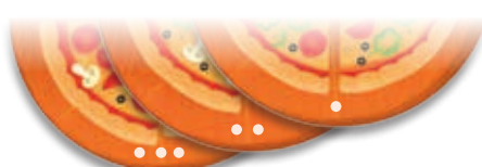
Сложность карт отмечена точками

В игре используются только круглые карты с пиццей. Сложность игры можно варьировать, отбирая карты соответствующей сложности: для начала лучше отобрать только карты с одной точкой, потом постепенно добавлять в колоду карты с двумя и тремя точками.