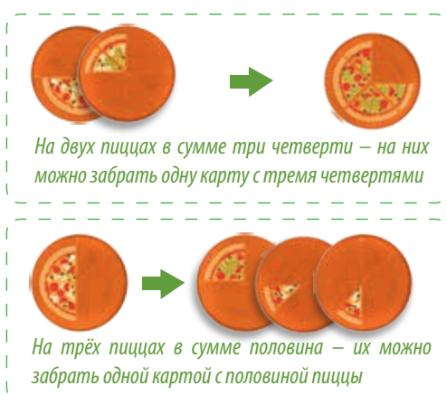
На двух пиццах в сумме три четверти – на них можно забрать одну карту с тремя четвертями

Если игрок в свой ход не может взять ни одной взятки – он добирает из колоды на руки одну дополнительную карту, а ход переходит к следующему игроку.