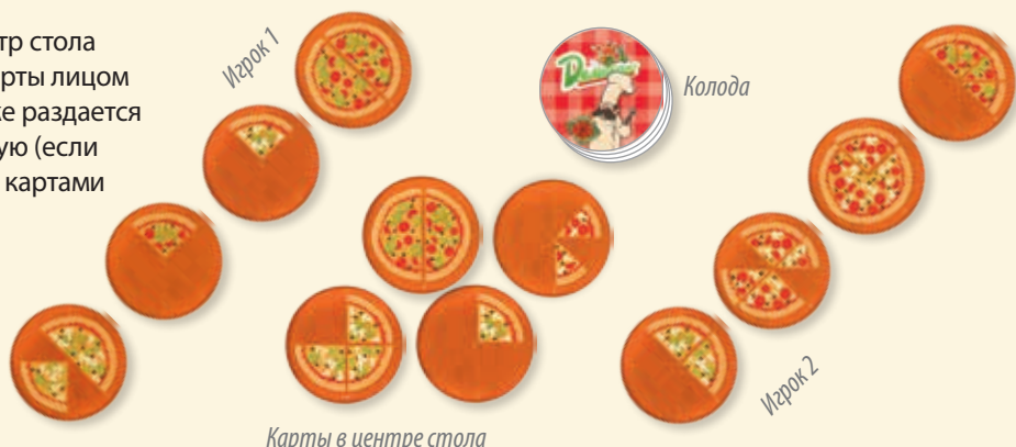
Карты в центре стола

В начале игры в центр стола выкладываются 4 карты лицом вверх, игрокам также раздаётся по 4 карты в открытую (если игра ведётся только картами с одной точкой, то раздаётся игрокам и выкладывается в центр по 3 карты).