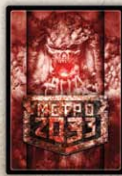
Угрозы второго этапа