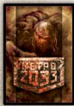
Угрозы первого этапа